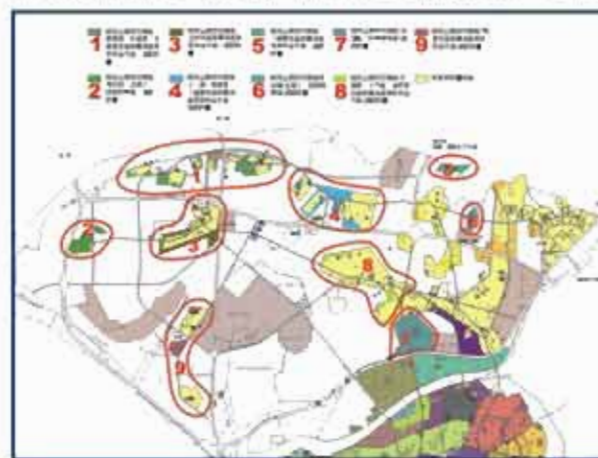
台南市安南區細部計畫範圍示意圖

二、91年重要本市三、四期發展區細部計畫禁、限建解除市民期待一、二十年的本市三、四期發展區十六處細部計畫，面積合計978.88公頃，終於在九十二年一月六日全部定案發布實施，展現了新政府上台後超快、實在的施政理念