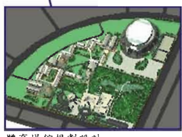
體育場館規劃設計