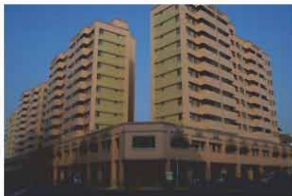
大道等六眷村 首批36-43坪、後批預計92年10月完工 售價：2,995,000元起 位置：長榮路五段及北門路二段