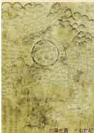
台灣位置，十七世紀