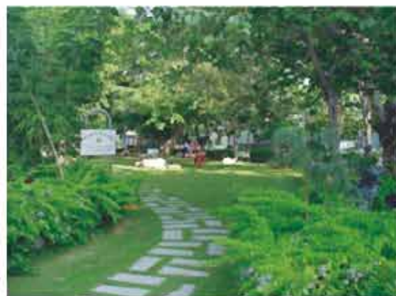
空地綠美化 成果示範