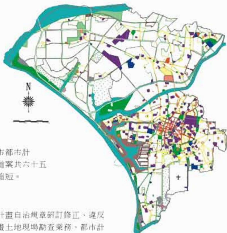
台南市主要計畫圖

於91年度共核發建築線指示(定)證明504件，土地使用分區證明19667件，並配合公共設施保留地之徵收或撥用需要，辦理有無妨礙都市計畫證明書之核發作業。數值航測圖對外發售業務：影印部分：90年2360件，91年2836件比去年增加476件。藍晒部分：90年660件，91年999件比去年增加339件。