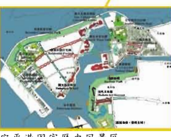
安平港國家歷史風景區

二、綜合規畫業務 (一)市綜合發展計畫 擬修訂計畫、擬發十年、變九四訂計年台、定發展願景、文化新展、國際大育城、報論發與教公、圖、(二)城鄉風貌改造、配合內政部營建署「擴大公、共辦九十年、預