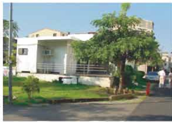
空屋環境綠 美化成果示 範