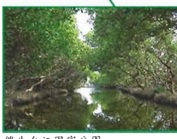
催生台江國家公園