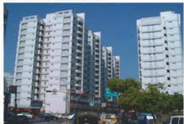
富台等四眷村 目前正在施工中預計92年3月完工 36-43坪尚未計價 位置：開元路與長榮路五段路口