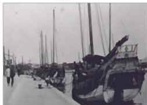
台南運河

發行人：李得全 編輯委員：蘇明吉、簡敏福、陳家慶、吳建德、莊德棧、陳奕榮 發行單位：台南市政府都市發展局 發刊日期：民國92年04月05日 地址：台南市永華路二段六號九樓 電話：06-3901422 傳真：06-2953362 電子信箱：BUD@aail.tncc.gov.tw 網址：http://www.tncc.gov.tw