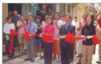
市長主持二期工程完工剪綵

神農街改造初期的嘗試與計畫的延伸，造就了三期延續性的工程，更因九十一年底海安路的通車及相關書籍介紹，讓神農街再造產生光與熱。二期工程於九十一年六月完工，當地居民自發性提出辦理街慶活動，成大建築系更特地將畢業展選擇八戶街屋清理舉辦展覽，吸引大批人潮，而將觸角更延伸向「五條港文化園區」的區域發展。