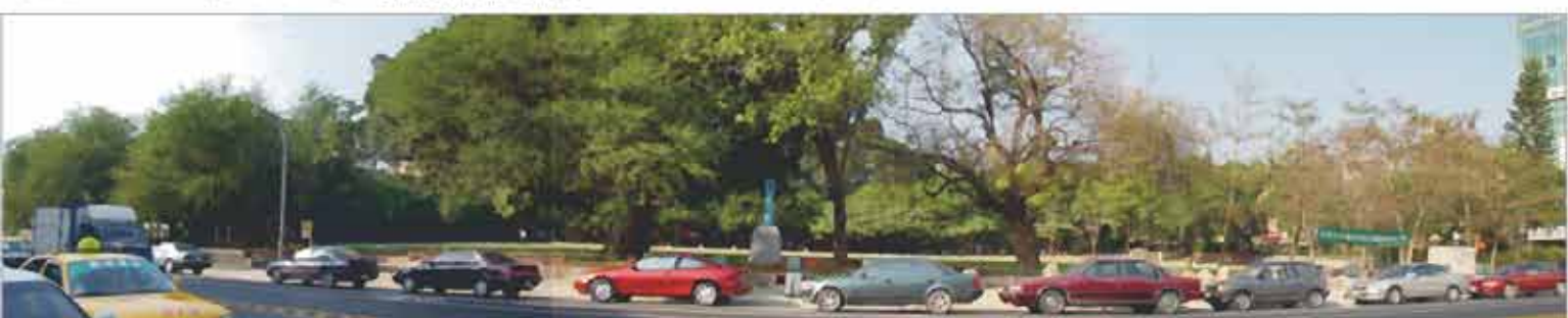
台南市會是一個綠色花園文化城市（圖：忠義國小操場改造一景）

在台南市政府目前的作法是除了逐年編列預算，進行公園綠地的土地取得與開闢外，在都市發展策略上，更擴大層面以運用閒置公有土地及透過變更回饋機制，來加速取得公園用地，並降低土地取得成本，大幅增加本市公園綠地面積，並透過公園、綠地結合園道系統、文化古蹟及親水環境的整體規劃，期能大幅改善本市都市景觀與生活環境品質，構築本市成為綠色花園的文化都城。