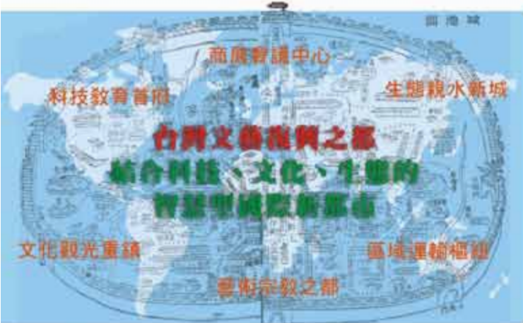
府城發展願景與方針