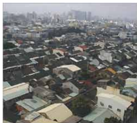
大道等眷村舊社區

有鑑於此，為推動全民社區福利政策與活絡自由市場房價機制，台南市政府遂於八十六年間在國家建設六年計畫廣建國民住宅、改建國軍老舊眷村之政府既定政策前提下，本著照顧中低收入戶及改善原舊有軍眷村之生活環境及品質，致力與國防部合作，積極推動國軍老舊眷村改建國民住宅，藉以去除舊有眷村頹腐、巷道狹隘之窳陋並兼顧社區公共安全之維護以改善社區環境，提昇居住品質與機能，促進都市整體均衡發展。