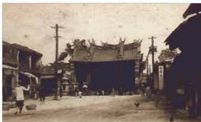
台南關帝廟