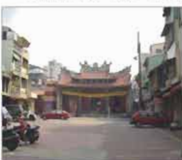
新美街歷史性街道再造工程

台南市政府於推動都市設計工作任務中，為改善台南市都市風貌，近年來積極推動都市空間改造計畫，於民國八十九年起已陸續推動完成永華路、新美街等歷史性街道再造工程，以及包含府中街、忠義國小操場、南門路人行步道改善等工程之孔廟文化園區再生計畫。民國九十二年更將以「城市入口」為主題，辦理「府城入口意象改善計畫」，來推動都市意象行銷，並培養市民及訪客對城市之認同與識別，打造台南市成為台灣文藝復興之都——一個結合科技、文化、生態的智慧型國際觀光都市。