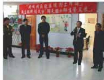
北區規劃工作站掛牌