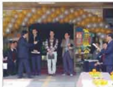
安南區社區規劃師