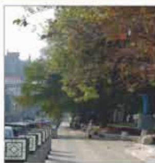
忠義國小操場景觀改善工程