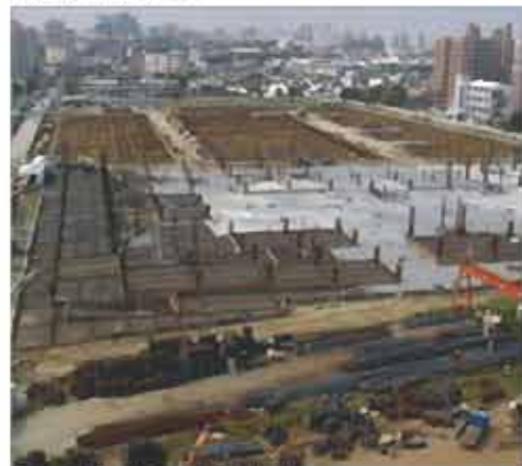
改建中的大道國宅社區基地