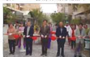
營建署長官蒞臨剪綵