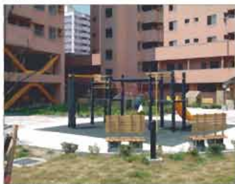
大道中庭—親子樂園

配設，戶戶通風採光良好，依都市計畫道路街廓計劃分為九個工區，形同鄰里單元組織，除每個工區均設置有獨立之大面積開放空間，地面配設完善之休閒兒童遊憩設施，就近全天候供住戶及附近居民共享外，於整體大道眷改基地之區位亦配置有「公兒31」、「公兒32」、「公兒33」等公園綠地，配合社區住戶進住闢建綠化植栽後，相較其他社區，更能顯現大道社區公共空間寬廣、公共設施完善、輕鬆享有、品味舒適生活之高級住家品質。