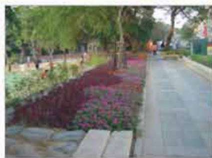
南門路人行步道改善工程