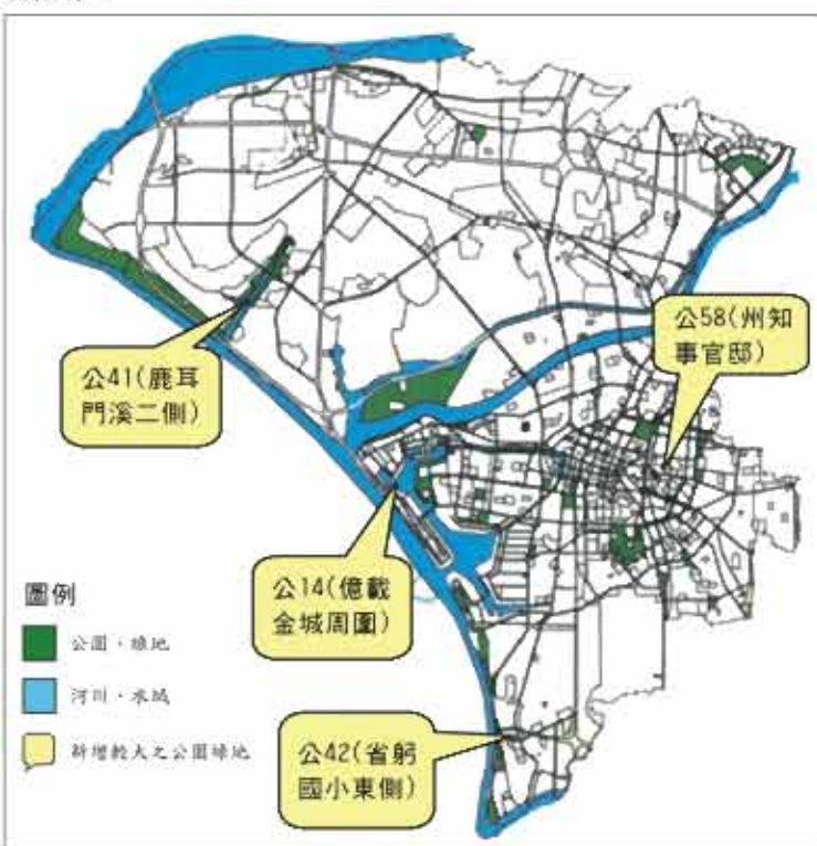
台南市主要計畫公園、綠地分佈示意圖

隨著社會進步，生活水準的提高，國人對於休憩生活的需求日益殷切，而公園綠地乃是都市生活中最重要的休憩場所，公園綠地可以美化都市景觀，淨化都市空氣，改善都市生態環境，因此都市中公園綠地的服務水準，乃成為衡量都市文明與品質的重要指標。