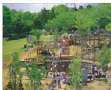
充滿活力的都市公園

在量的方面，本市主要計畫第四次通盤檢討前，主要計畫公園綠地面積580公頃；在四通中運用閒置公有地以及透過變更回饋機制，於今年元月十六日第一階段發布實施後，公園綠地面積增加76公頃，合計面積為656公頃，同時預計在第二階段公園綠地面積大約可增加450公頃，合計公園綠