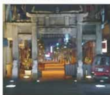
府中街公共空間改造工程