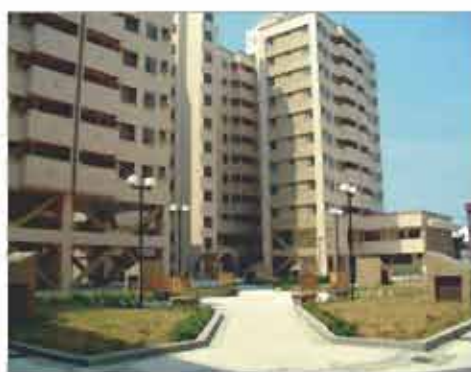
美侖美奐—大道之巔