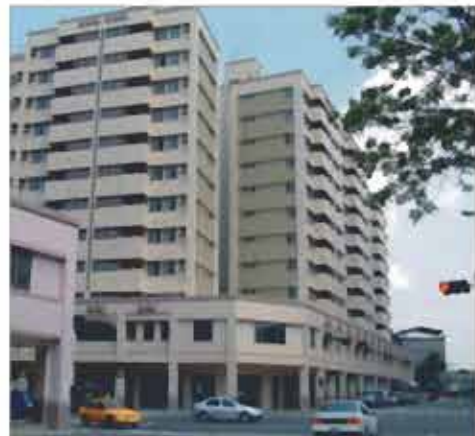
再生大道—今非昔比

大道眷改基地位處「府城」北門城郊，屬現行北區行政區域，為扼居「府城」外出北上必經之要道咽喉，其地勢平坦，目前北門路、長榮路、公園路等均已開發完成人口密集，大眾運輸如火車站、公路客運近在咫尺，交通臻為發達與便捷，公共設施諸如學校有大光國小、開元國小、公園國小、成功國中、延平國中、民德國中、台南二中、聖功女中、成功大學等。醫療設備有台南醫院、成大附屬醫院、慈愛醫院、奇美醫院其西側又有全市最大零售市場—延平市場，可謂得天獨厚至善住家地段，都市計畫並據住宅編定，暨為維持其先天優良居家品質起見，已公布實施容積管制建築地區。