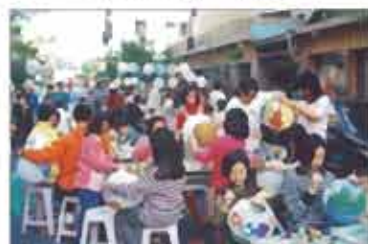
居民參與元宵街慶

你是否曾經嚮往過住在一個有蟲鳴鳥叫聲溫柔喚起的早晨，有花香、樹蔭、枝頭在風中搖曳陪伴著的午后時光，左鄰右舍相互扶持、共同學習與成長的社區呢？在東區的蘭心巷，我們可以看到一羣人正為共同的環境改造而享受著家園的甜美果實。巷道的故事，則一則的在這裡展開，讓居民的心更靠近了。在蘭心巷很多人會說：這就是我生活的地方。沒錯，這是一個適合人生活的地方，也是一個充滿人情味的地方，因為這裡有熱忱、有創意、有奉獻，更有無私無我的精神，他們創造了一個美麗境界——「台南府城桃花園」。