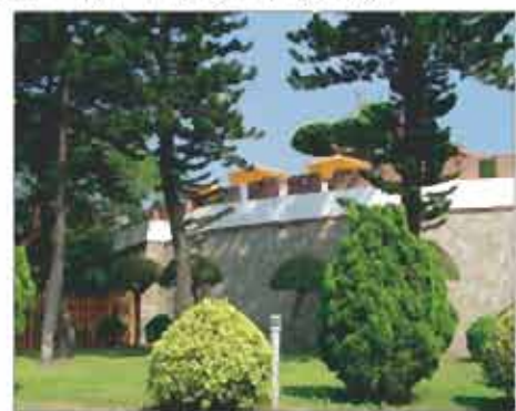
古蹟與公園的結合(大南門)

而在規劃理念方面，主要計畫第四次通盤檢討中公園綠地規劃著重於與文化古蹟及親水環境的結合，如：配合市定古蹟州知事官邸，運用周邊公有土地規劃「公58」公園用地（面積0.58公頃），以結合古蹟與公園成為古蹟公園；在鹿耳門溪兩側，運用公有土地規劃「公41」公園用地（面積47.84公頃），以結合河川與公園成為親水公園；此外更於億載金城周邊，運用港埠用地規劃「公14」公園用地（面積26.87公頃），以結合港區水域與一級古蹟成為古蹟親水公園等均屬典型案例。此外在四通第二階段中，更將串聯、延伸、擴大公園道系統，結合河川水域、公園綠地，期使本市成為綠色親水之都。