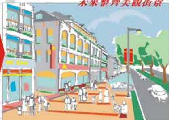
未來整齊美觀街景