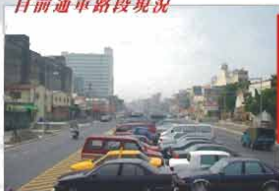
目前通車路段現況