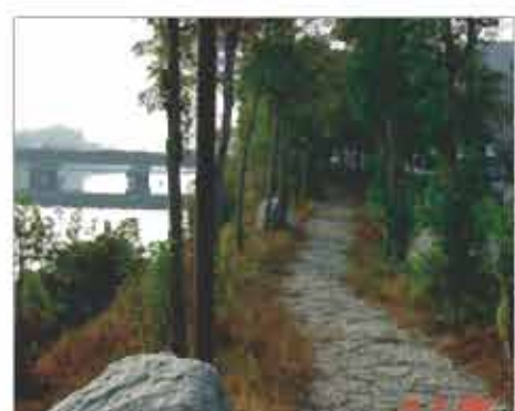
綠意盎然河岸景觀

誠然就目前而言，全南市373處公園綠地中，已開闢使用者116處，開闢處數比例僅達三成，合計開發面積約132公頃，開發面積比例則更僅達現有計畫面積20%，每人實際享有公園綠地面積為1.77平方公尺，發展現況與計畫尚有相當落差，要達到先進國家的綠地水準，尚有許多市府待努力的空間。