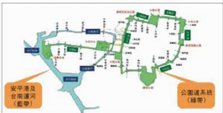
台南市藍綠帶及節點分布圖