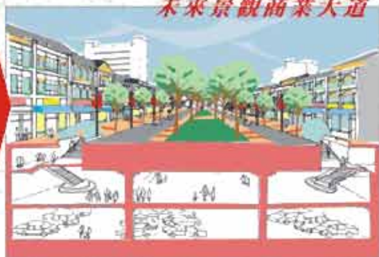
未來景觀商業大道