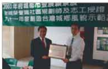
並將此榮耀呈予市長