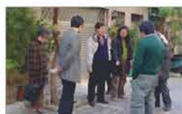
社造委員實地督導