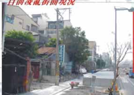
目前凌亂街面現況