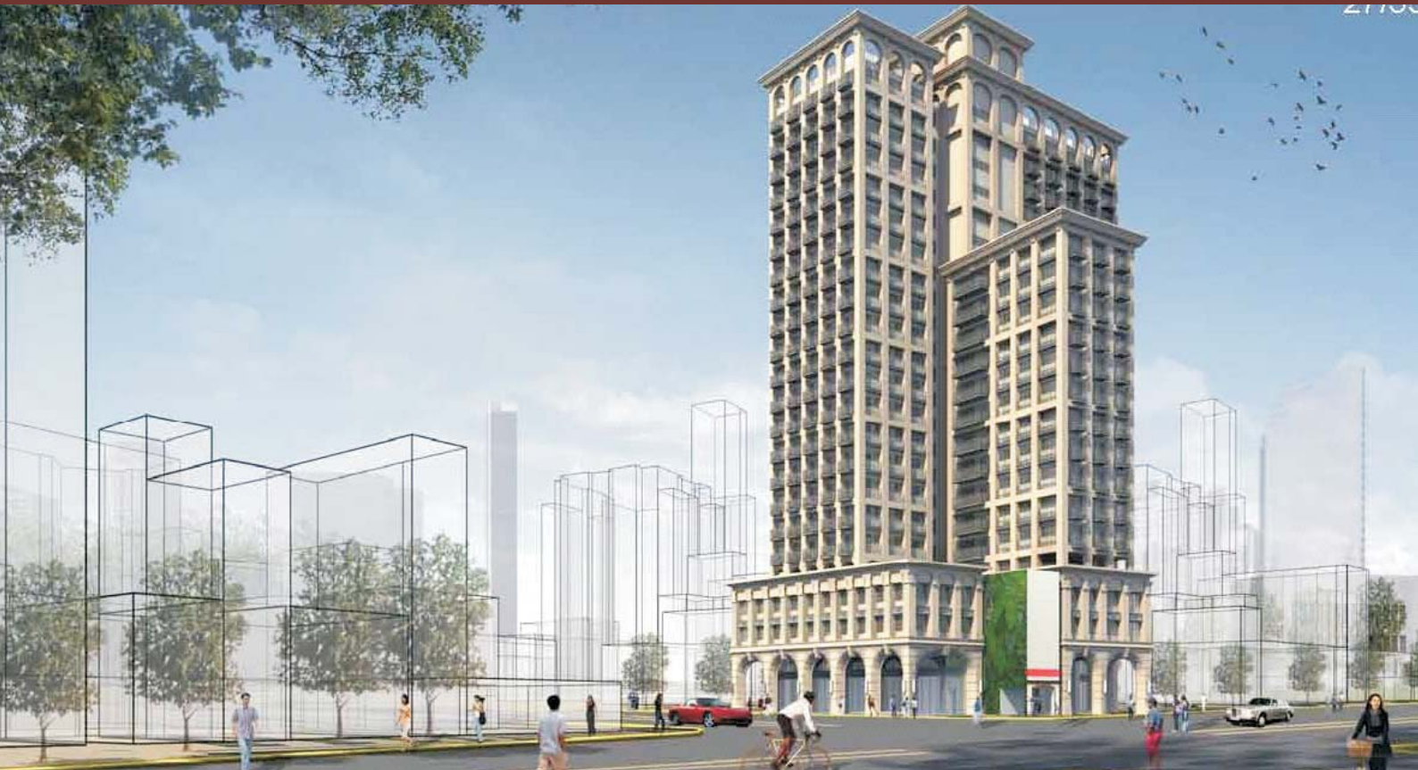
更新構想模擬示意圖